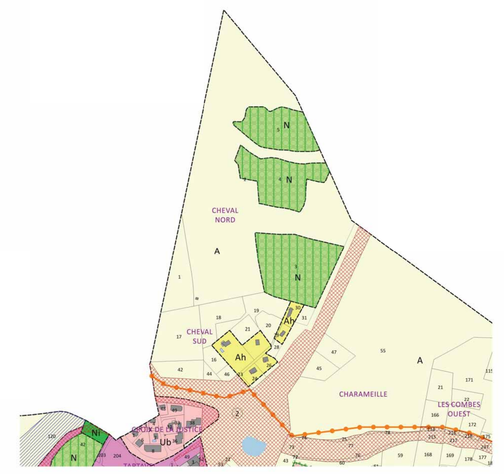
PARTIE NORD Echelle : 1/5000